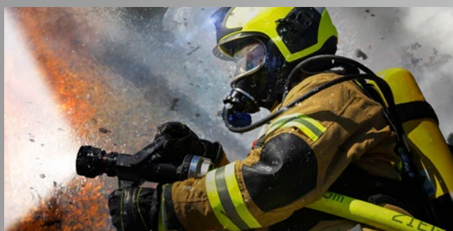
Schläuche und Ausrüstung