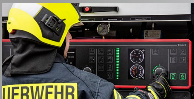
Steuerung und Bedienung